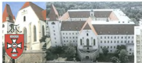
Seminar: Theresianische Militärakademie Wr. Neustadt