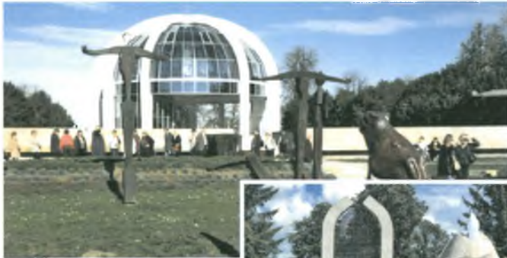
Exkursion: Südungarn Gedächtnisstätte: „Schlacht bei Mohacs 1526“ November 2013