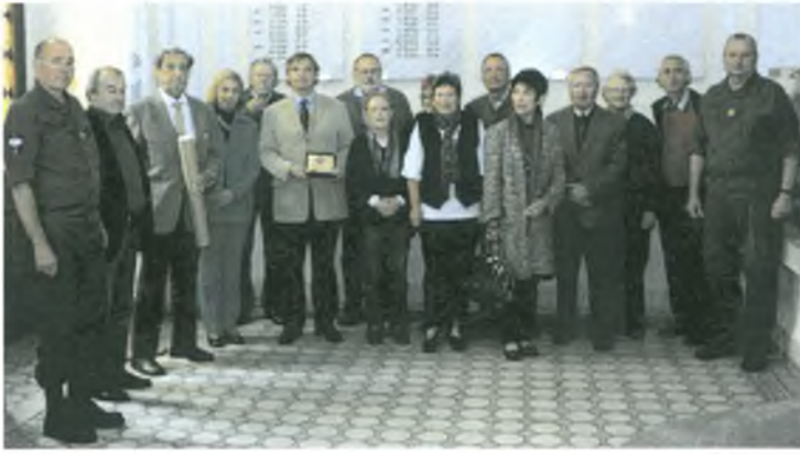
Exkursion: Heeresunteroffiziersakademie - September 2013